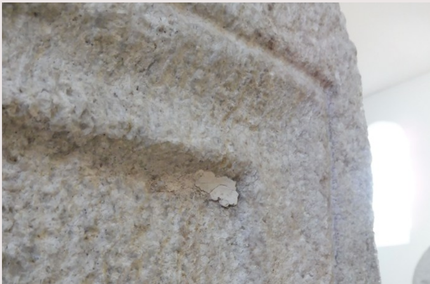
Stuckrest an der rechten Nebenseite.