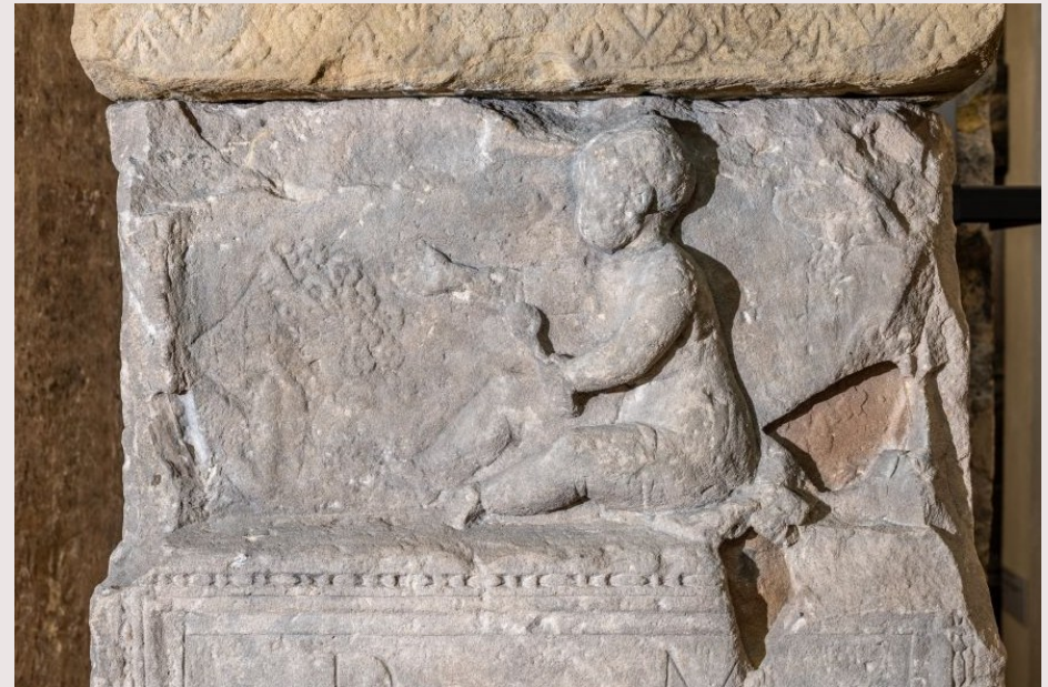
Oben: Im Bildteil mit Kleinkind haben sich Toneinschlüsse ausgelöst. Unten: Ausschnitt aus der Inschrift.

D(is) M(anibus) / Telesphoris et / maritus eius parentes / filiae dulcissimae / queri necesse est de / puellula dulci / ne tu fuisses / si