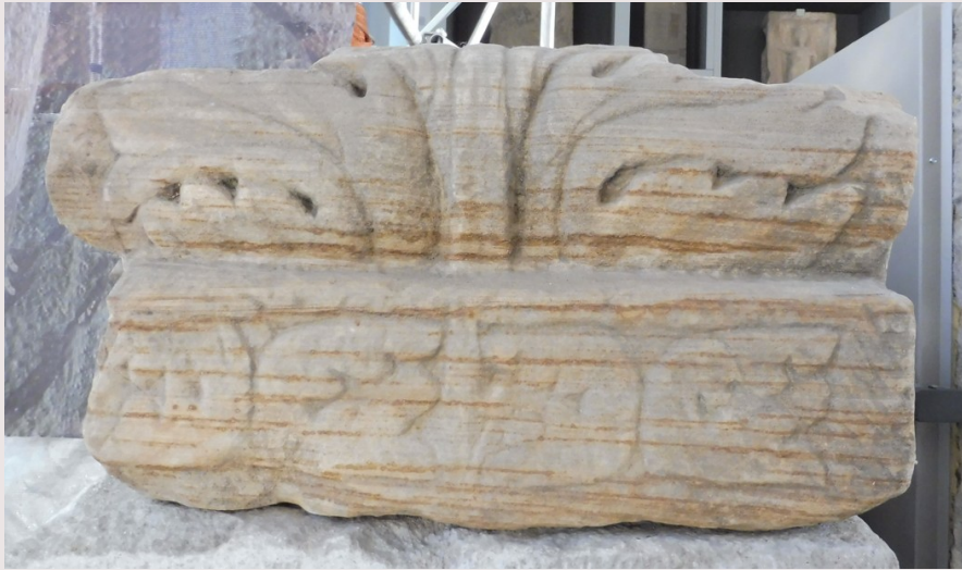
Aufsatz des Marmorgrabsteins aus gebändertem Sandstein.