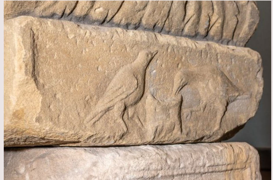
Oben: Rechtes Seitenrelief mit Tauben um ein Gefäß.

Über einem Kassettenornament mit Rosetten ist mittig in einem dreieckigen Giebel eine bärtige Blattmaske dargestellt, links und rechts durch sogen. Altarkissen (pulvini) flankiert. Auf der rechten Nebenseite umrahmen zwei Tauben ein henkelloses Gefäß, aus dem einer der Vögel trinkt (s. Abb.). Aus einem Gefäß trinkende Tauben finden sich auf römischen Grabsteinen häufiger; sie stehen für die sich am Quell (hier Gefäß) des Lebens erquickende Seele. Auf der linken Nebenseite wird ein Käuzchen von zwei kleineren Vögeln (Sperlinge?) geneckt (s. Abb.). Eulen werden als Nachtvögel und wegen ihres unheimlichen Schreiens als Totenvögel angesehen.