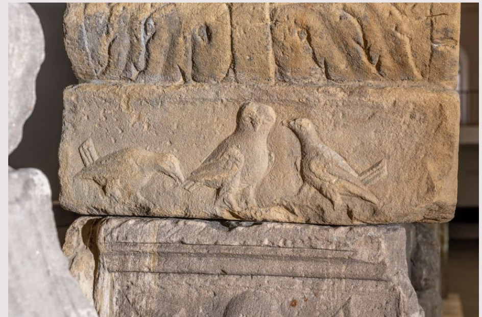
Unten: Linkes Seitenrelief am Aufsatz mit einem Käuzchen und zwei kleineren Vögeln.