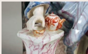
Höchster Porzellan, Teetrinker (Detail), um 1752/53, erworben 2014 mit finanzieller Unterstützung des Vereins der Freunde des Landesmuseums Mainz e.V.

Einladungen zu exklusiven Previews sowie allen Ausstellungseröffnungen des Museums, ermäßigten Eintritt, Einladungen zu den Führungen, Vorträgen und Veranstaltungen.