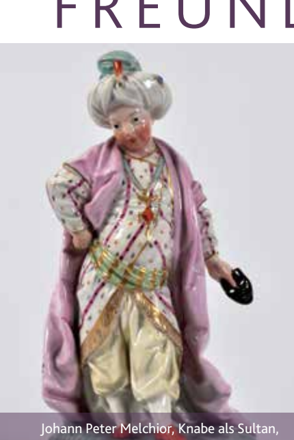
Johann Peter Melchior, Knabe als Sultan, um 1770; erworben mit finanzieller Unterstützung des Vereins der Freunde des Landesmuseums Mainz e.V.

WIR FÖRDERN das Museum ideell und materiell.