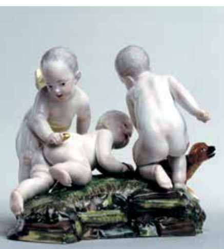
Höchster Porzellanmanufaktur, spielende Putti mit Hund, 1770 – 80; erworben mit finanzieller Unterstützung des Vereins der Freunde des Landesmuseums Mainz e.V.

LANDESMUSEUM MAINZ Rita Müller Telefon: 06131 2857-132 Fax: 06131 2857-288 E-Mail: rita.mueller@gdke.rlp.de