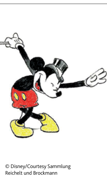
© Disney/Courtesy Sammlung Reichelt und Brockmann